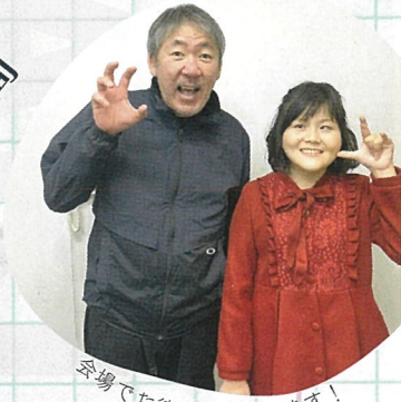
会場でお待ちしております！